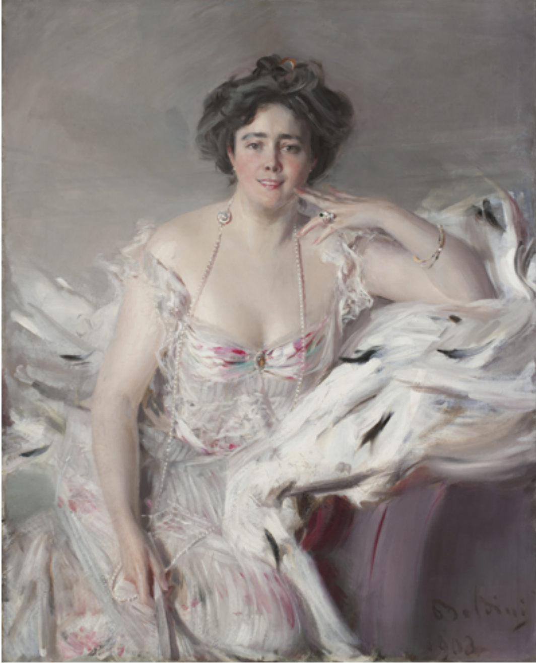
Giovanni Boldini, Lady Nanny Schrader , 1903, olio su tela.