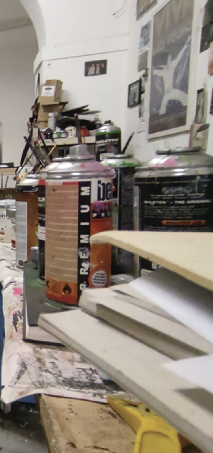
Veduta studio Luca Bellandi.

Dove si trova però la modernità nell'opera di Bellandi? Questi manichini che vengono da lontano come si integrano nel mondo dell'artista? Fluttuanti in una dimensione spazio-temporale indefinita, si ritrovano in compagnia di segni intrusivi che vanno a graffiare la composizione e che vengono dall'universo underground e pop, imprescindibile bagaglio iconografico di Bellandi. Possono manifestarsi sottoforma di fiori di warholiana memoria ( Oriental windows. Nippon songs ), colature di pittura che rimandano alla pittura d'azione della scuola americana ( Slow, I'm Juggler ), di elementi grafici e scritte ( Danza macabra, Lettura bianca, Regalo green ), che richiamano la cultura underground, così come la corrente concettuale.