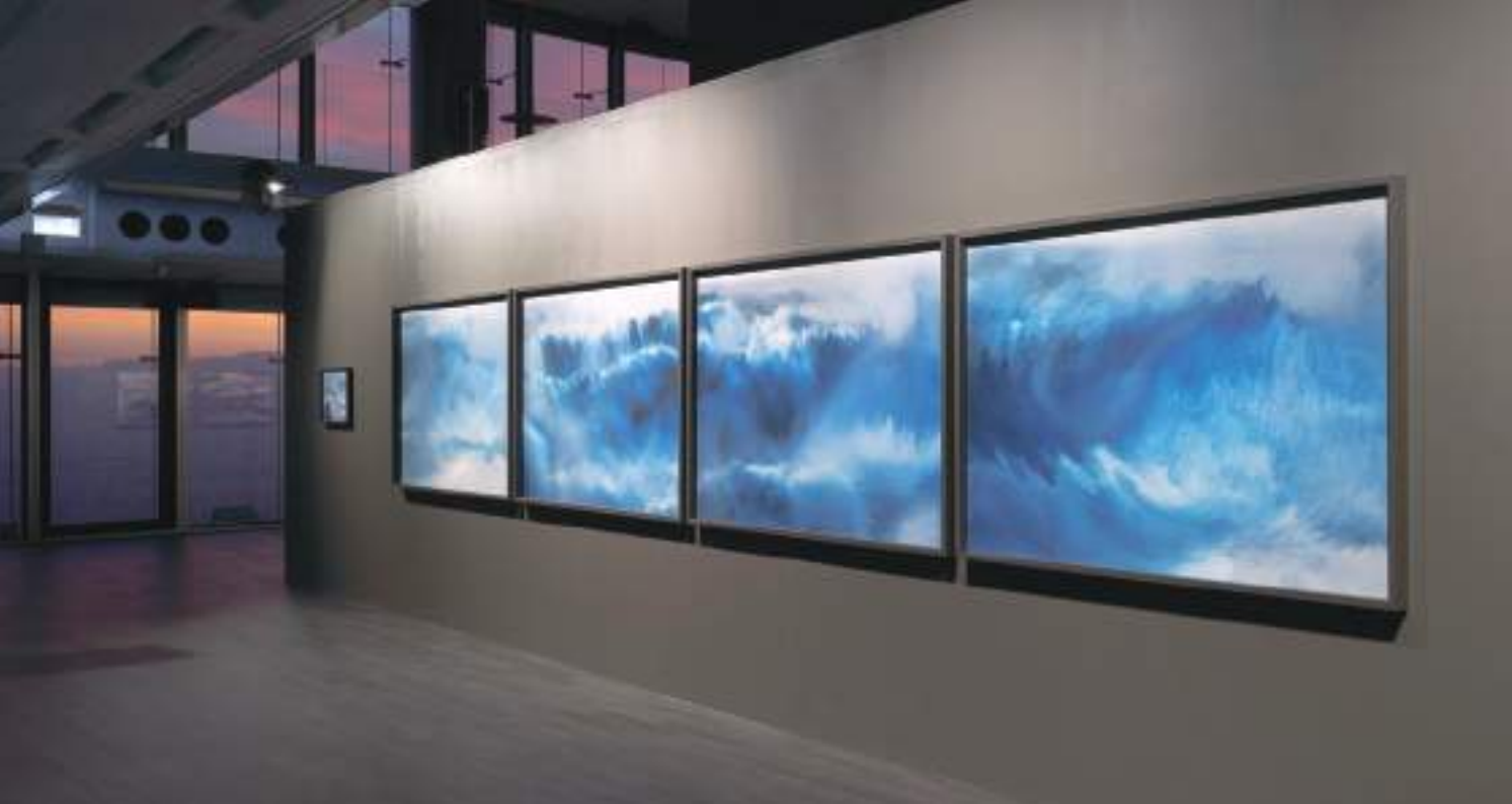
Quayola, Storms. installation view, 2023.

di Roma, Ercolano, Pompei, Paestum, Segesta, e nei suoi colori. Gli artisti viaggiatori catturati dal sentimento per la luce mediterranea che avvolgeva questi paesaggi di memoria classica iniziarono una sperimentazione tecnica e formale che porterà a un nuovo sguardo e a un nuovo linguaggio di sintesi ed immediatezza, su cui si innesterà la "La teoria dei colori" di Goethe prima (1810) e la rivoluzione elettromagnetica di Maxwell poi (1873). Fino a Constable, a Turner e al Romanticismo vero e proprio, al en plein air e alla grande stagione della pittura di paesaggio naturalistico, impressionista e macchiaioli: la rivoluzione industriale, scientifica e tecnologica porterà all'innovazione dell'arte, della visione, della società e della cultura.