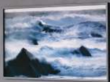
Quayola, Storms , installation view, 2023.