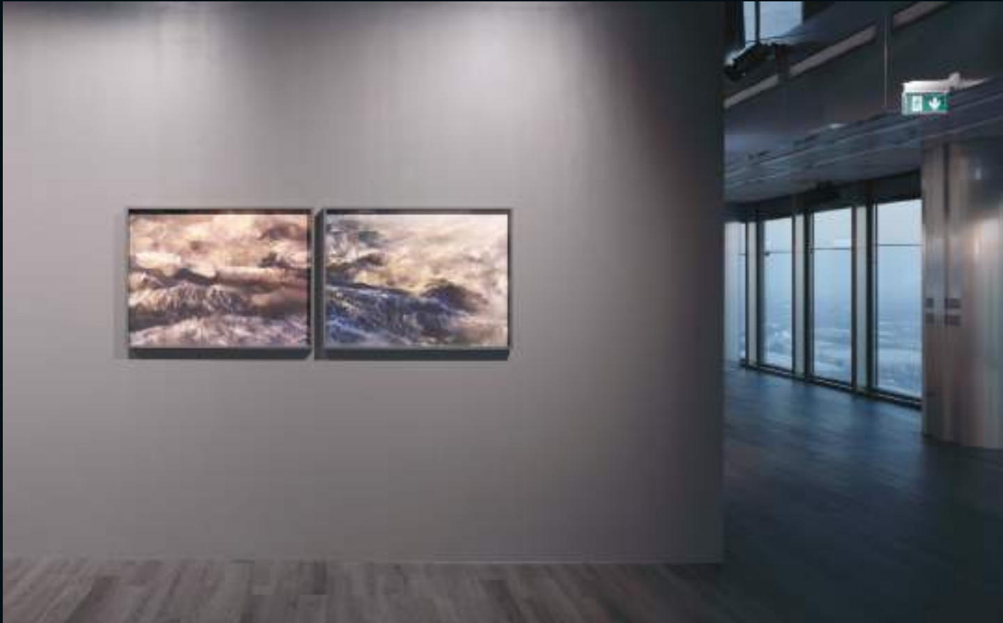
Quayola, Storms , installation view, 2023.