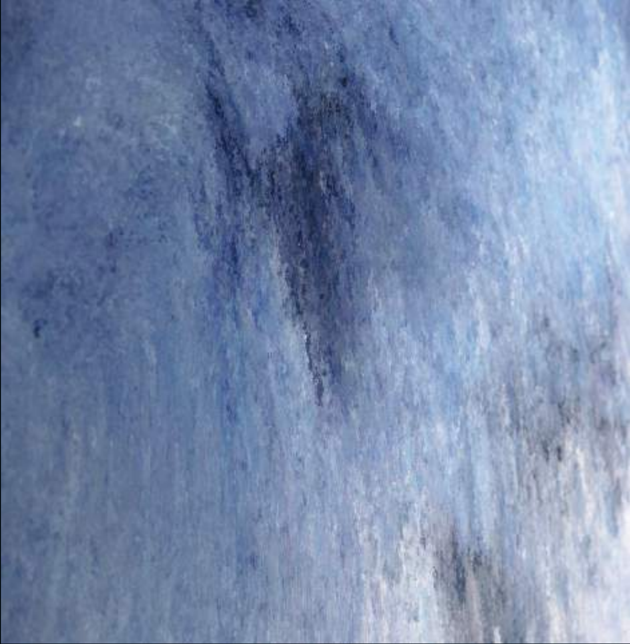
Quayola, Storm (detail), Inkjet Print, 2022.