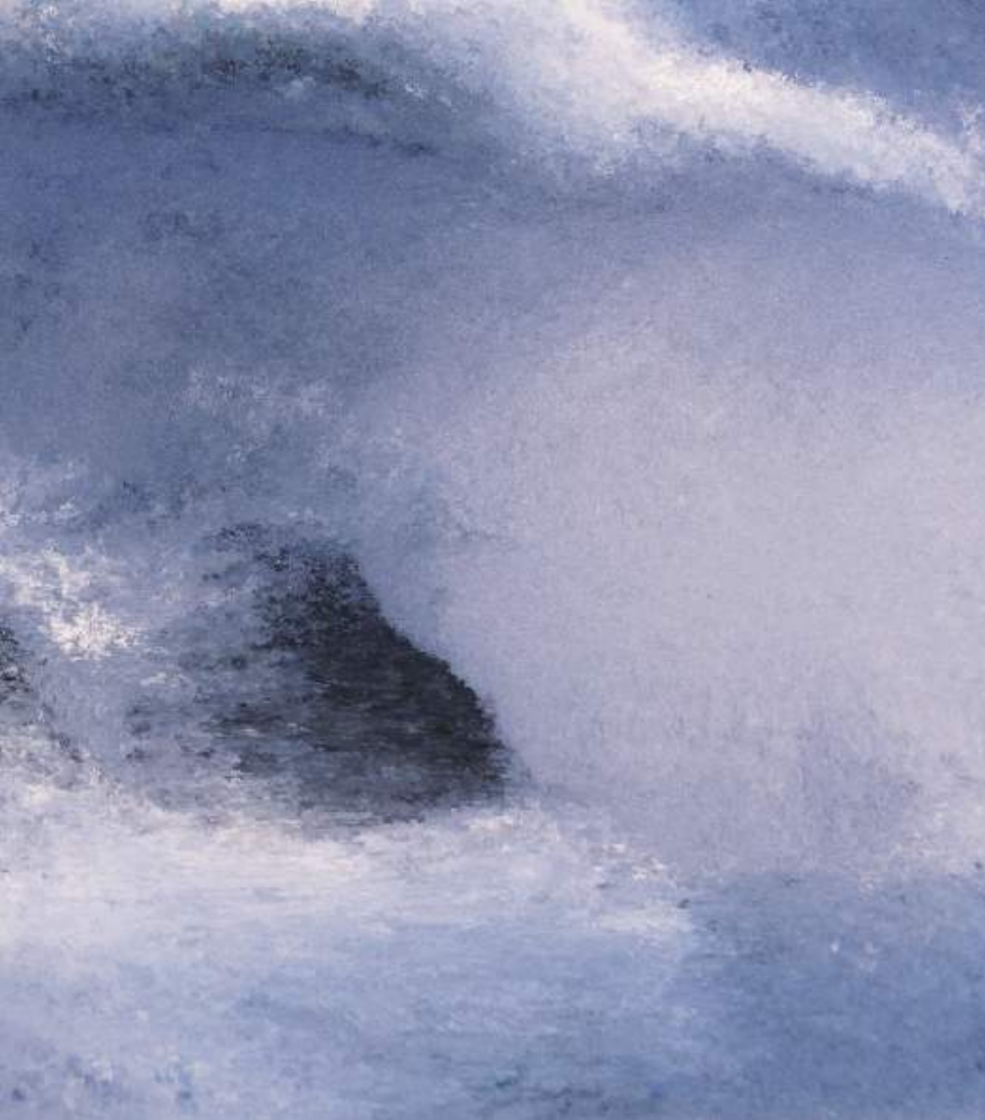
Quayola, Storm (detail) , Inkjet Print, 2022.